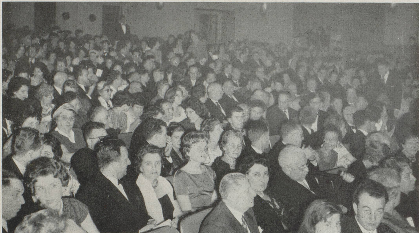
Salle comble ! Les Suisses et leurs amis sont accourus nombreux à la fête de Bienfaisance