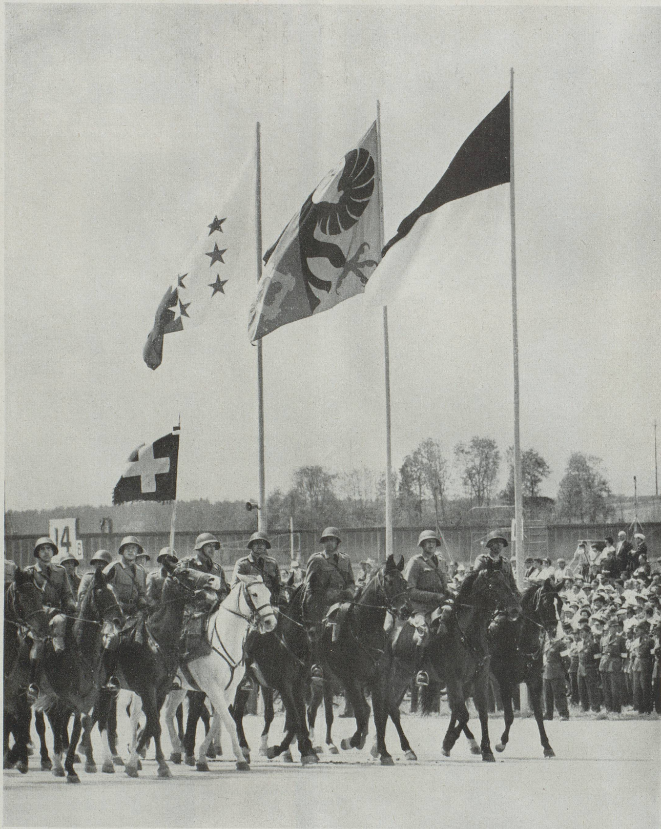
La troupe la plus applaudie : la cavalerie, comme toujours