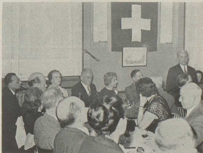
Le traditionnel banquet fut suivi de discours

Pendant le repas, une chorale féminine, créée spécialement à cette intention, s'est fait entendre à plusieurs reprises et la soirée s'est terminée par des chants collectifs et de la danse.