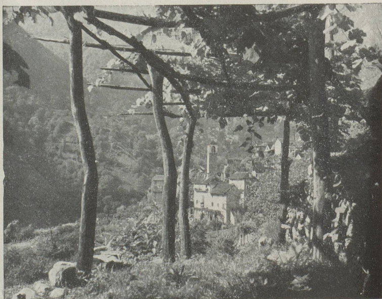
Village dans le Val Verzasca

Les communes où cette diminution se remarque le plus, — Ascona et Orselina l'ayant depuis longtemps, — sont Castagnola, Ronco-sur-Ascona, Agra, même si le pourcentage étranger de leur population a légèrement diminué. Toutefois la liste des communes déficitaires, en tant que population tessinoise, vient de s'allonger. Mélide et Bissone, communes charmantes des rivages du lac de Lugano, voient leur population augmenter, mais ce ne sont pas de nouveaux berceaux tessinois qui la fournissent... Ce sont des amoureux de leurs beautés naturelles qui viennent vivre dans ces lieux enchantés. Il en est de même de Muralto, Carabbia, Pambio-Noranco, Sorengo, Paradiso, Minusio, Morcote, Vico-Morcote, Chiasso qui ont tous une population tessinoise en nombre inférieur et un pourcentage d'environ 60 % d'étrangers ou confédérés. Chiasso, qui est une petite ville frontière, n'est pas dans la joute : il est compréhensible qu'il en soit ainsi. Et il en est de même pour des communes qui, du fait de leur industrialisation, comptent dans leur population un grand nombre d'étrangers et de celles, qui étant très appréciées par les beautés de leur configuration naturelle, attirent le monde. Mais comment expliquer, par exemple l'excédent de Pambio-Noranco, de Carabbia, communes où sans doute il fait bon vivre, mais qui n'ont pas