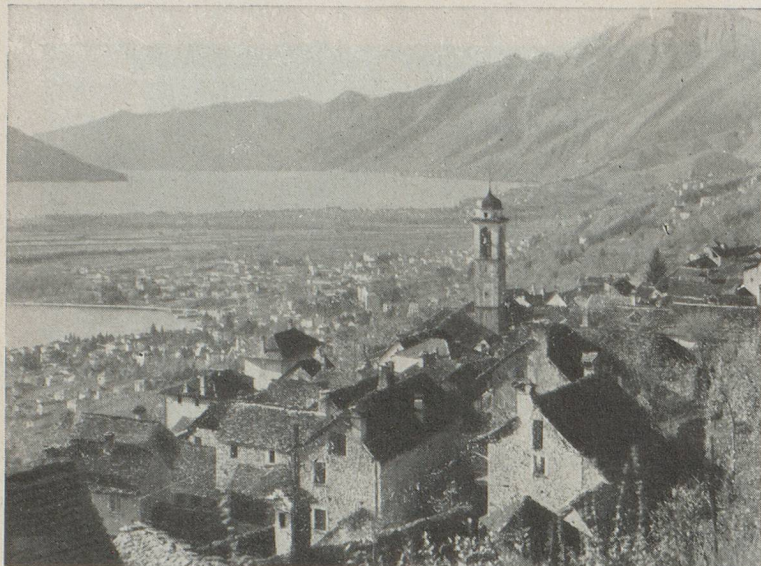
Locarno vue de Brione