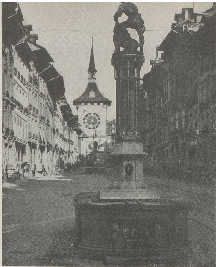
La Tour de l'Horloge

de Lausanne, qui se lancent dans une affaire que le Conseil fédéral appelle « une initiative hardie ». La convention prévoit une disposition permettant à la Société chargée de l'exploitation de prélever des droits de péage. Or, les experts de la Confédération prévoient un trafic animé pendant les mois d'été, mais un trafic modeste en hiver, les touristes faisant entièrement défaut.