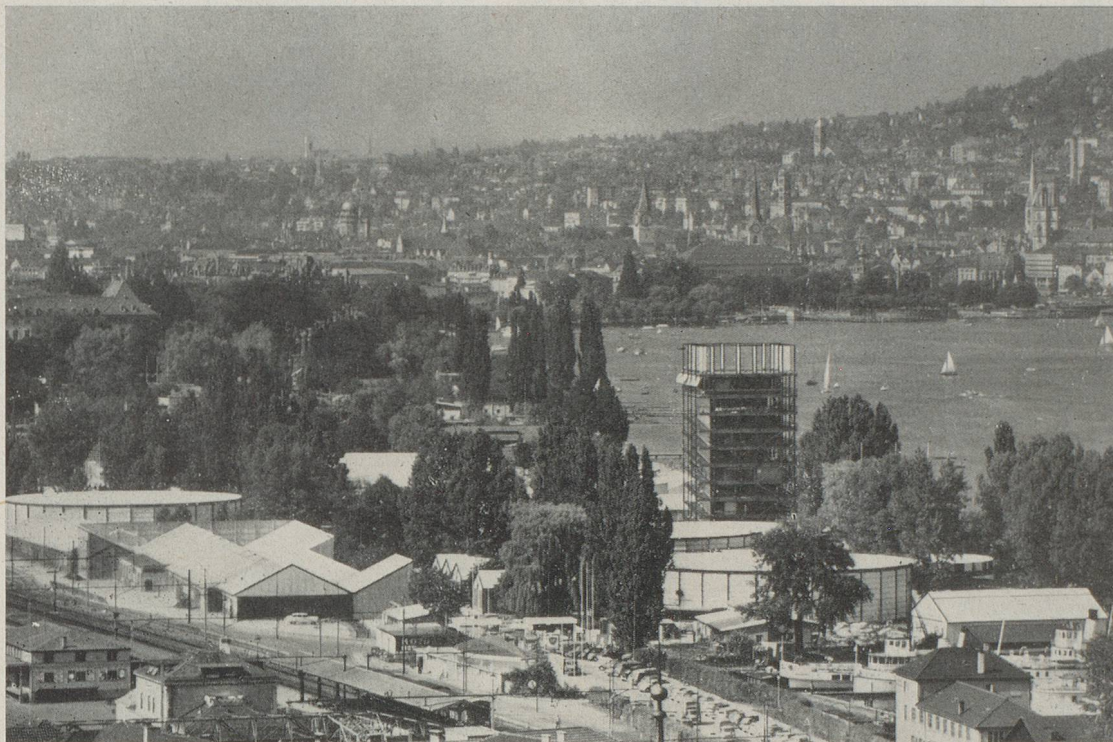
La SAFFA 1958. Vue générale avec le lac et la ville de Zurich