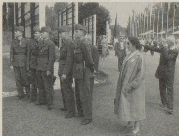
Quelques jeunes recrues, venus de l'étranger pour faire leur service au pays (photo en haut), et nos hôtes du «Home» (photo en bas) visitant la SAFFA 1958 lors de la Journée des Suisses à l'étranger à Baden - Zurich

Les cours, excursions, etc... n'ont lieu qu'en cas de participation suffisante; pour le reste, se référer aux conditions d'inscription figurant sur notre prospectus.