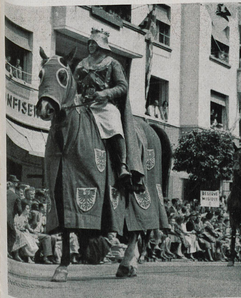
Berthold IV de Zähringen, premier seigneur attitré de ces lieux, fonda Fribourg en 1157.