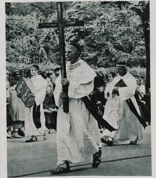
Catholique depuis toujours, Fribourg fut aussi l'émanation des saints hommes en qui se retrouvaient à la fois les vertus les plus chrétiennes et l'énergie des pionniers : voici les Pères d'Hauterive.