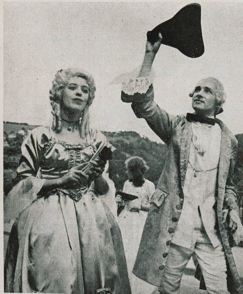
Dans les siècles passés, l'aristocratie fribourgeoise joua un rôle important, non seulement dans la vie de la cité, mais dans celle du pays. Portant perruques, tricornes et belles robes du temps passé, elle figurait aussi dans le merveilleux cortège.