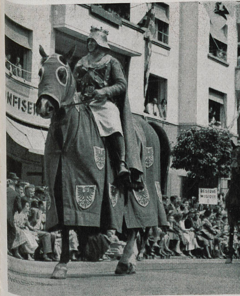
Berthold IV de Zähringen, premier seigneur attiré de ces lieux, fonda Fribourg en 1157.