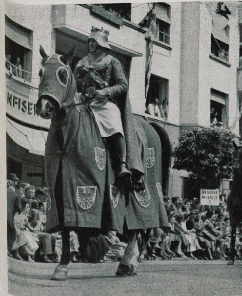
Berthold IV de Zähringen, premier seigneur attiré de ces lieux, fonda Fribourg en 1157.