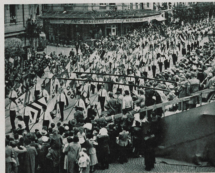
L'impensable défilé des drapeaux des 284 communes fribourgeoises terminait le cortège

cément fragmentaire, qui vous incitera peut-être à vous replonger de temps à autre dans vos livres d'histoire. Le cortège avait été précédé, le matin même, d'un « acte commémoratif » solennel, qui se déroula en présence des plus hautes autorités du pays. Il a été complété, sur différents plans, par des expositions historiques, artistiques, des fêtes et bals populaires, et une quinzaine gastronomique. Le tout s'est échelonné sur près de trois semaines — c'est dire que le bon vieux pays de Fribourg a bien fait les choses.