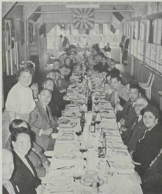
Déjeuner amical du CERCLE SUISSE ROMAND 15 septembre 1957