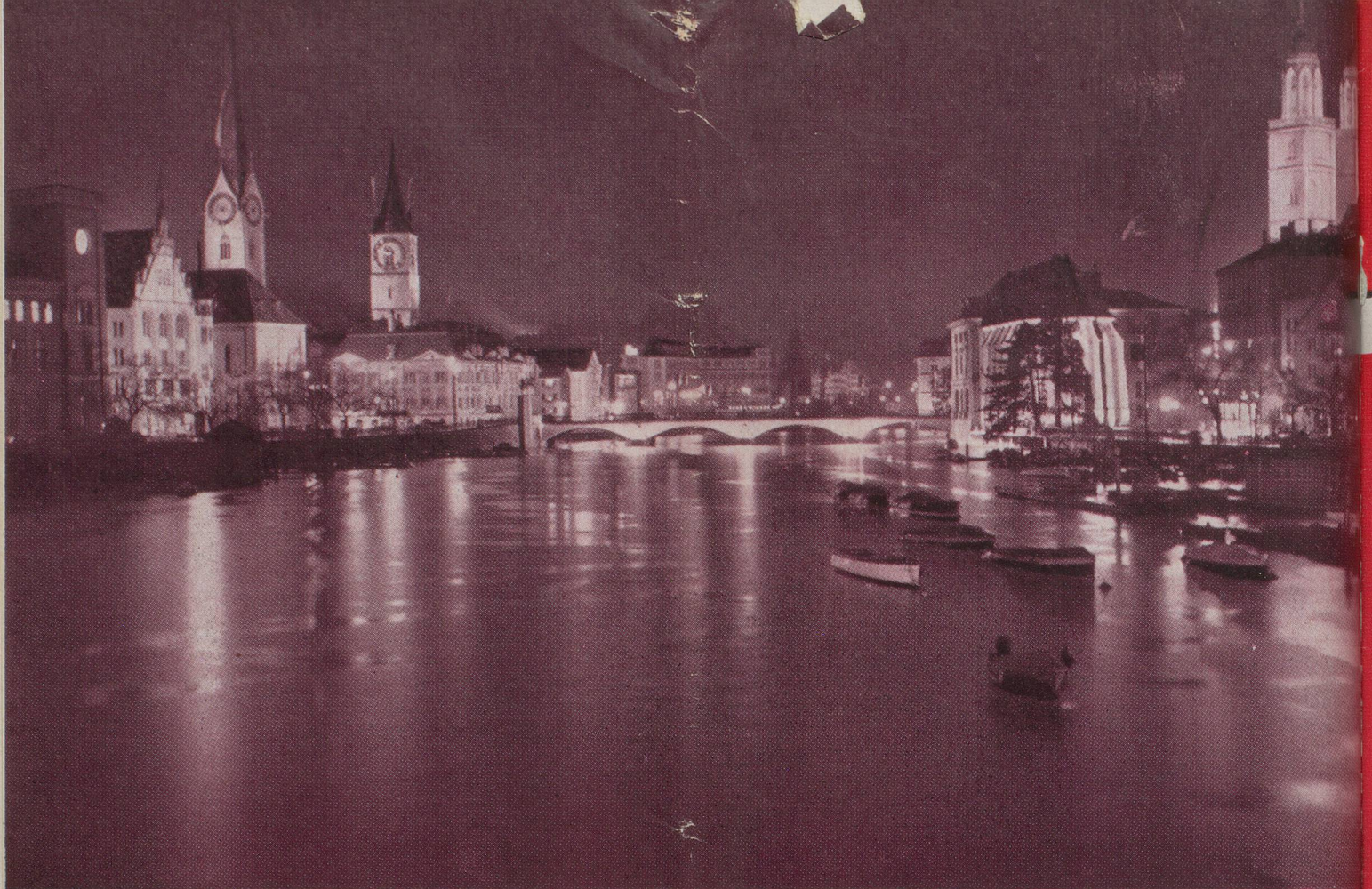
ZURICH LA NUIT