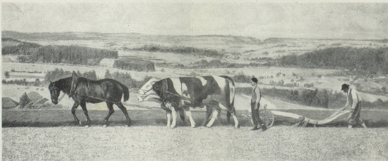
Musée d'art Lausanne