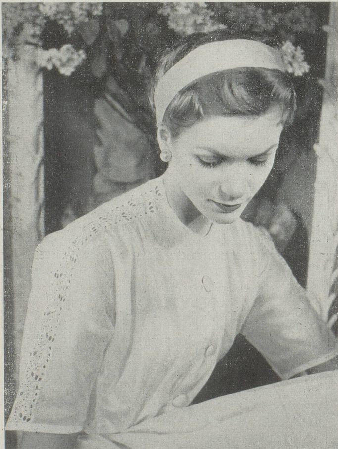
Blouse de linon à entre-deux de dentelle de Saint-Gall. Modèle J. Dessés

Nos lectrices ignorent peut-être que tous les couturiers de Paris apprécient nos tissus. Chaque année, ils présentent de somptueux modèles réalisés en broderie de Saint-Gall. En voici quatre des plus ravissants. Photos Grove. Reproduct. interdite.