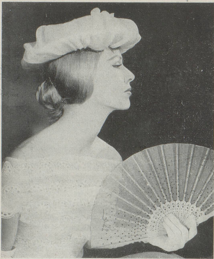
Robe du soir blanche créée par Sagardoy