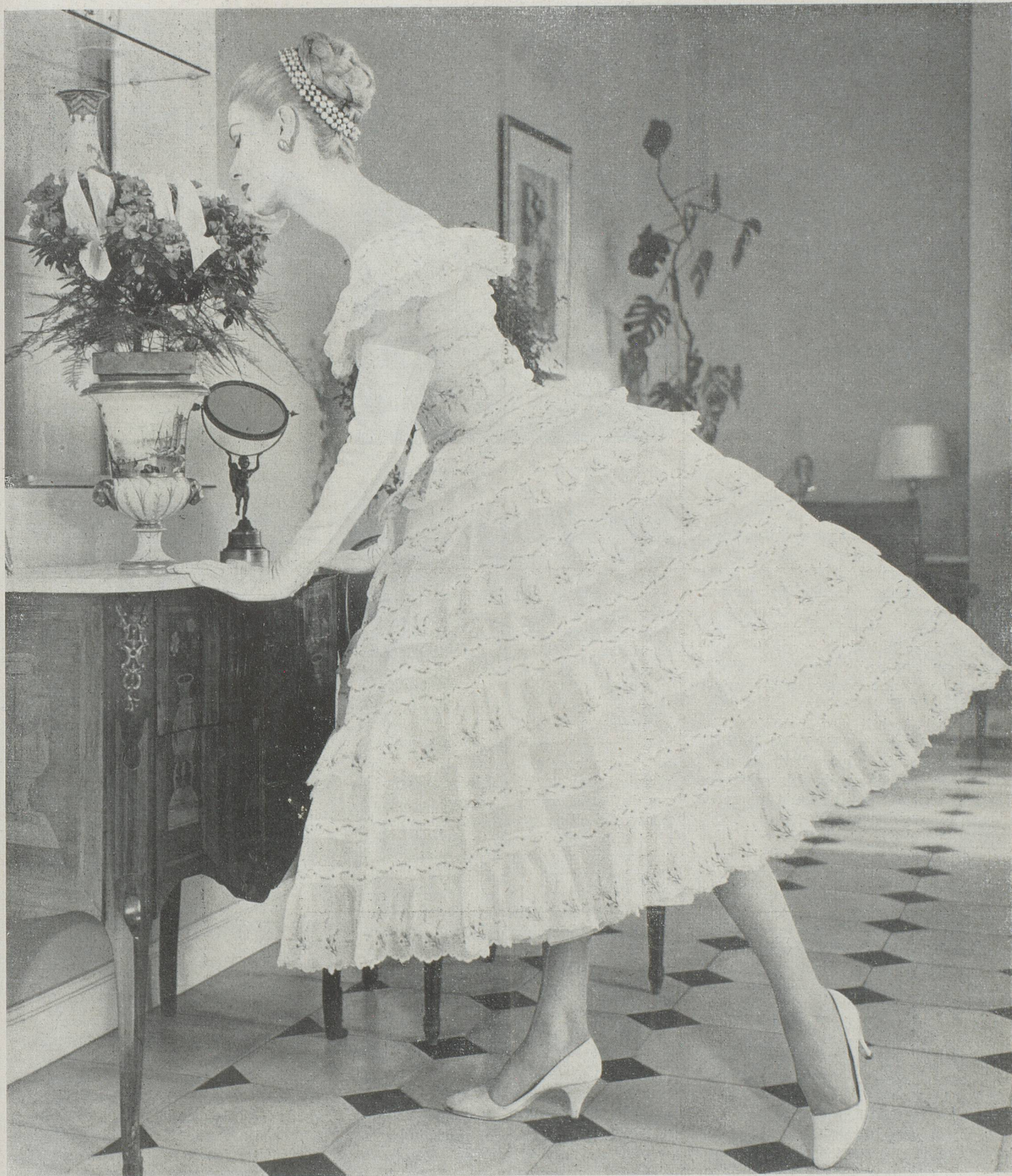
Robe du soir en organdi brodé. Modèle Ch. Dior, boutique