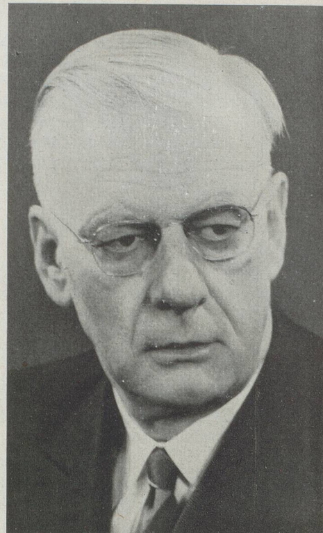
CONSEILLER FÉDÉRAL MARKUS FELDMANN

Né le 7 février 1896, originaire de Bütschwil (St-Gall). Études de droit de 1915 à 1920 à Bâle, Genève, Berne et Rome, docteur en droit en 1920. Pratique le barreau dès 1920 à St-Gall. Membre du Conseil de l'Ecole des hautes-études commerciales de St-Gall. Président de la Commission fédérale des banques de 1951 à 1954. Député au Grand Conseil du canton de St-Gall de 1936 à 1954. Député au Conseil national de 1937 à 1954 (président pour 1952/53). Au militaire : Colonel de l'Etat-Major général. Le 16 décembre 1954, l'Assemblée fédérale l'élit Conseiller fédéral en remplacement du Conseiller fédéral Rubattel, démissionnaire.