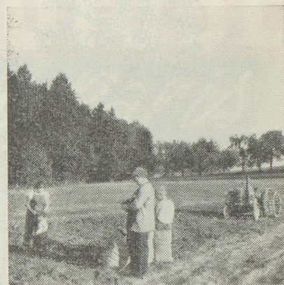
Les pensionnaires du «Home» suivent avec grand intérêt les travaux d'automne à la ferme du «Home»