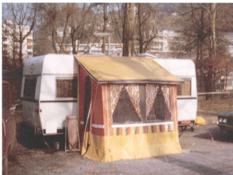
Ein halbes Jahrhundert ist's her. Winterplatz Lido Luzern.

Wir danken den Sponsoren für die Unterstützung all unserer Aktivitäten und Projekte zum 50-Jahr-Jubiläum