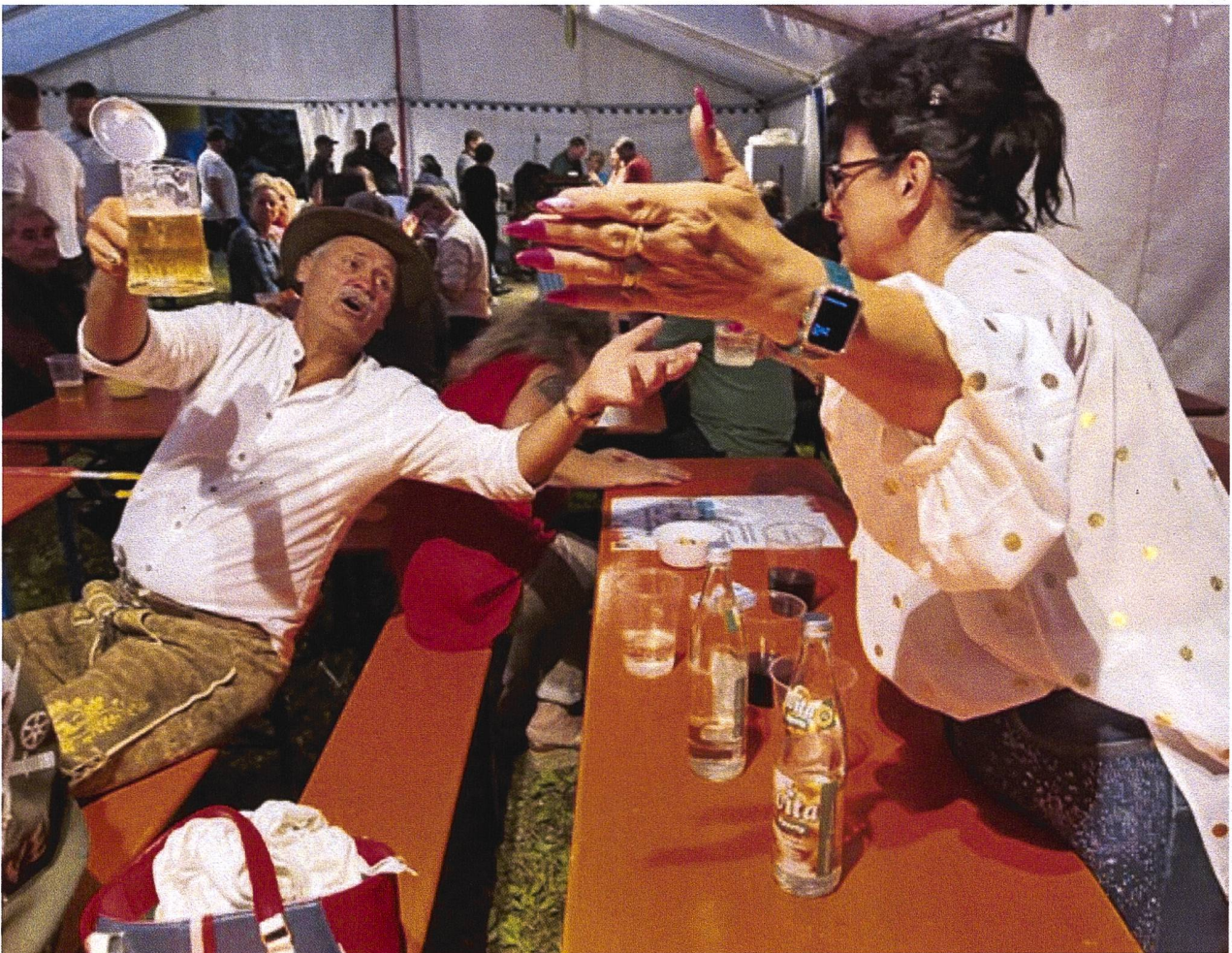
Verschwisterung über die Grenzen. Deutschland (links), Schweiz (rechts).