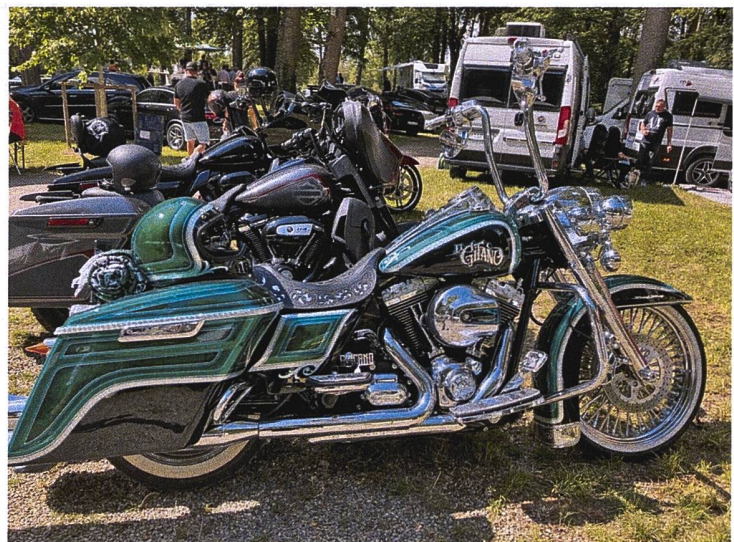
Tanz im Festzelt, die Festanlage unter Bäumen, die fröhliche Schweizer Delegation und ein Prunkstück von einer Harley; die Jenischen in Ichenhausen haben einen eigenen Töffclub.