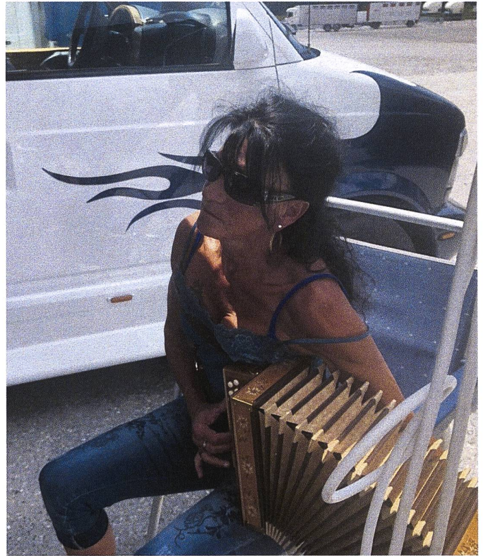
Stimmungsmacher: Die Bündner Spitzbuaba, bekannt durch den Film «Unerhört Jenisch» (unten).