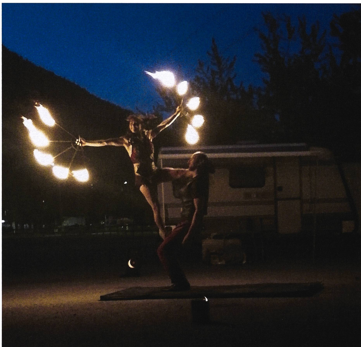
Nachtzauber: Das Duo Wasabi und Chocolat mit ihrem Feuertänzen.