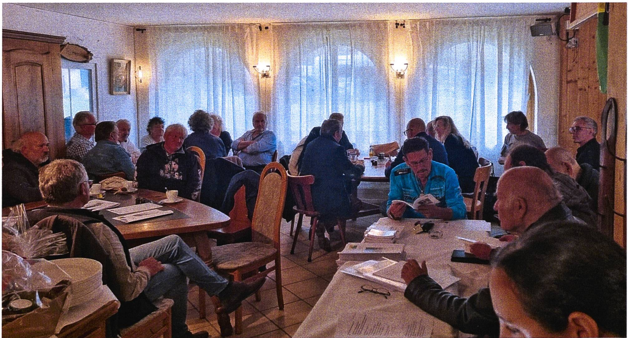
Generalversammlung 2022 der Radgenossenschaft im Restaurant auf unserem Campingplatz Rania.

Unten und rechte Seite: einige Impressionen.