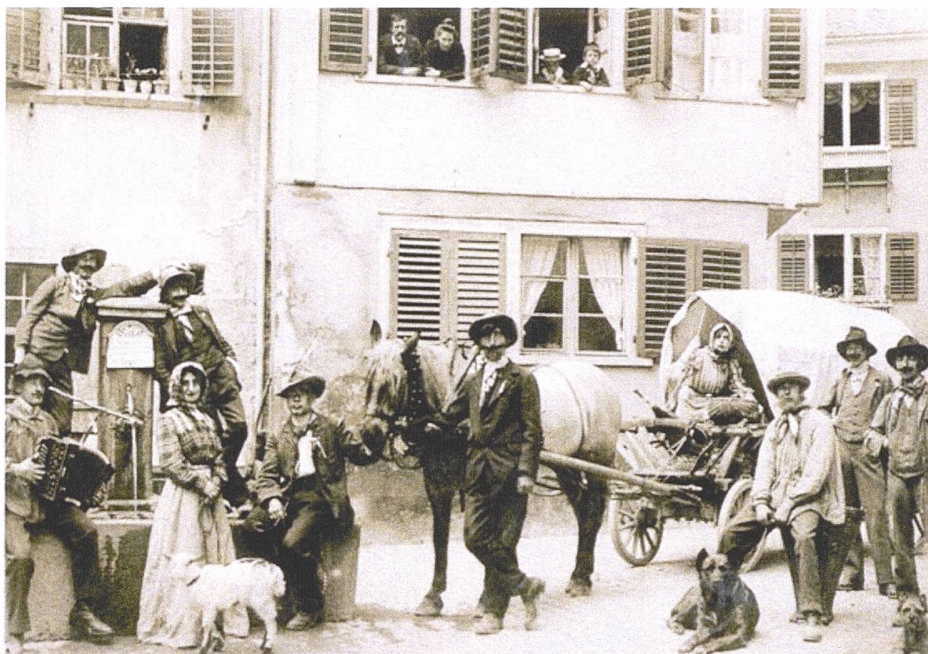
Einzug der «Fecker» in Chur. Vermutlich eine Inszenierung für den Fotografen.

Wir freuen uns darauf, sie 2021 – hoffentlich – voller Festfreude am selben Ort durchzuführen, also Freitag, 18. Juni, bis Sonntag, 20. Juni, Obere Au in Chur