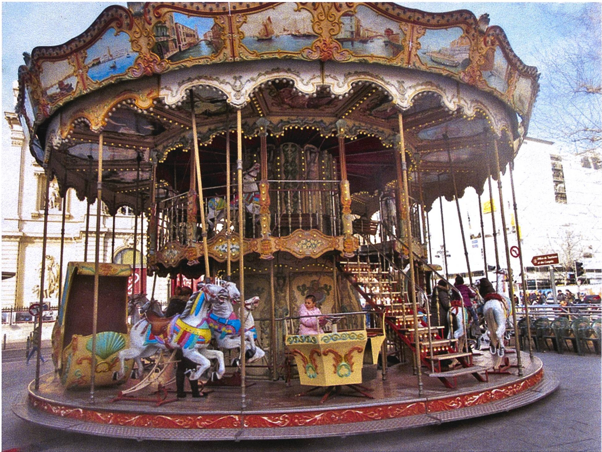
Auf dem Karussell des Lebens – Ein Prunkstück von Schaustellern in Marseille, 2019.

Ausgabe Juni 2019 Vierteljährlich Erstmals erschienen 1976