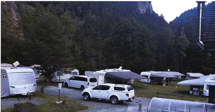
Gut besetzter Platz im September 2018.

Unser Campingplatz war diesen Sommer wiederholt voll besetzt. Einige unschöne Vorfälle betreffend Ordnung und Zahlungsmoral haben die Stimmung ein wenig getrübt. Aber die meisten haben grosse Freude am Platz, der auch eine Art jenesches Kulturzentrum ist.