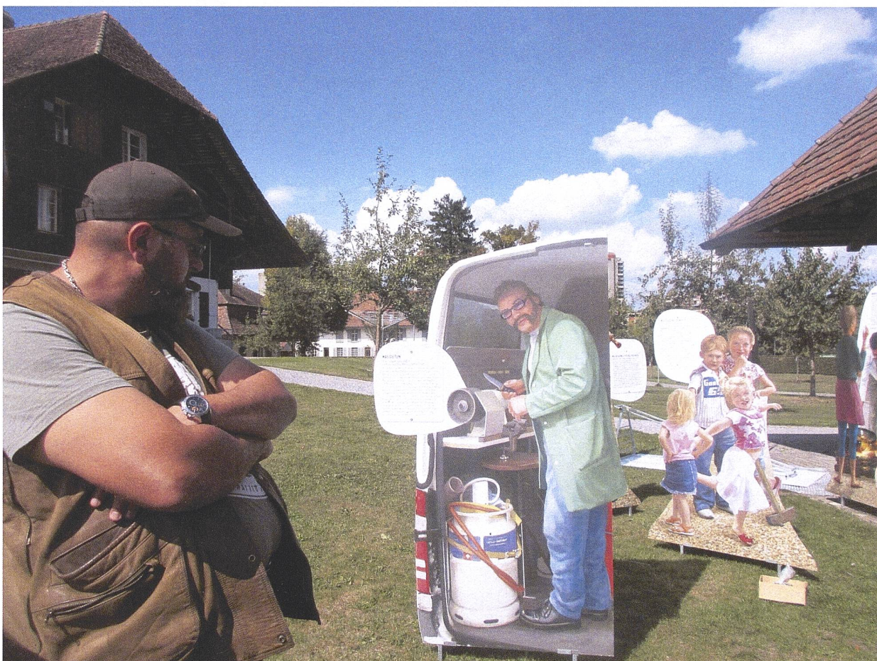
Die Wanderausstellung der Radgenossenschaft, hier im Freien in Bern 2018.