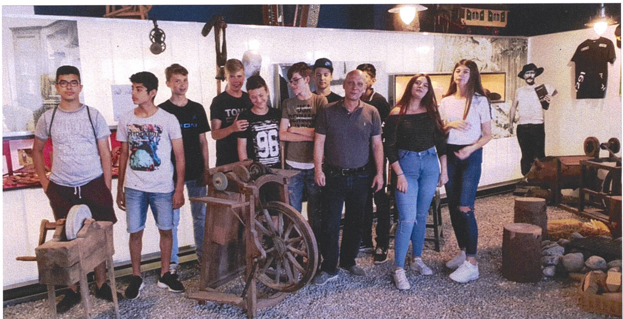
Projektwoche einer Sekundarschulklasse aus Buchs ZH, Besuch im Dokuzentrum der Radgenossenschaft in Zürich-Altstetten.