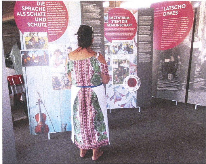
Erstmals gezeigt: Die neue Wanderausstellung der Sinti Schweiz.

20 Jahre Bern-Buech Bern-Buech ist ein Pionierplatz. Nicht nur ist er der erste solche Platz, der in der Schweiz geschaffen wurde. Er ist europaweit ein Musterbeispiel, wie Jenische und Sinti zusammenleben können. Aus Anlass des 20-Jahr-Jubiläums organisierten die Sinti Schweiz ein tolles Fest. Sie präsentierten auch ihre neue Wanderausstellung. Nur ist der Platz heute zu klein für die Jungen, die nachwachsen.