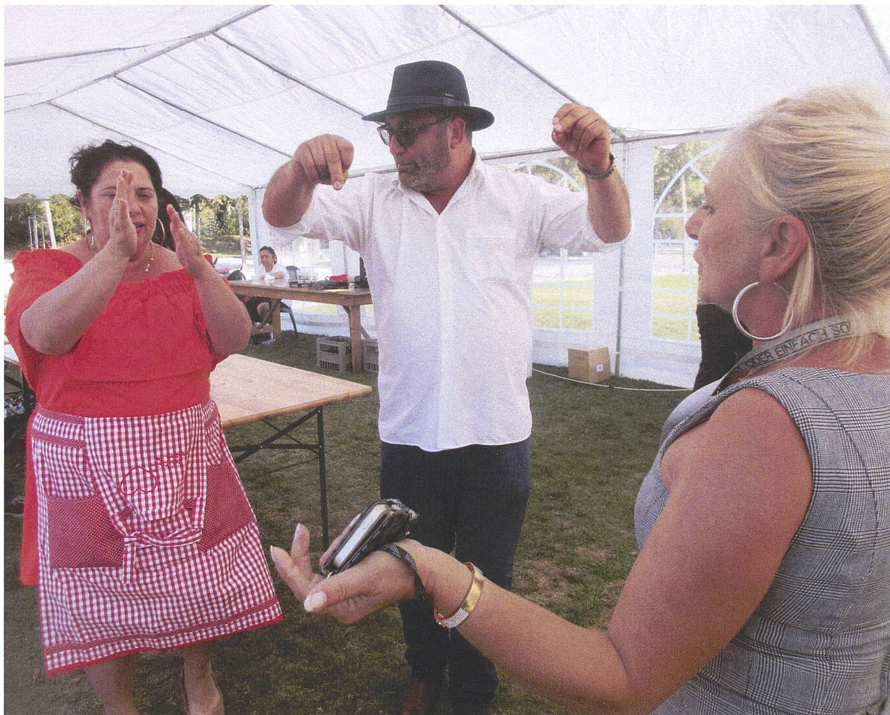
Sinti-Frauen beim Tanz, mit dem Präsidenten Fino Winter.