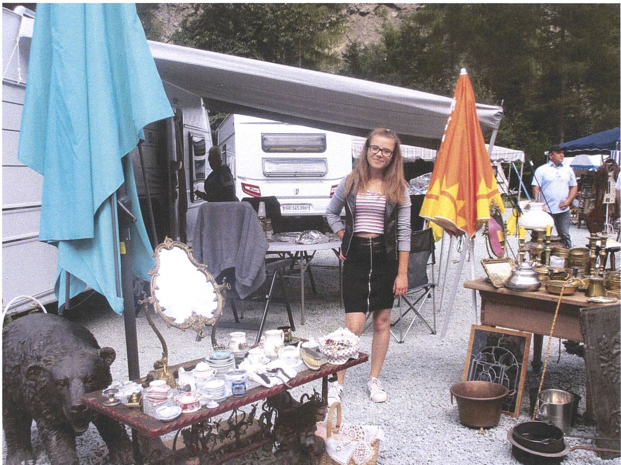
Junge jenische Händlerin auf dem Sommermarkt in der Rania.

November 2018 Jahrgang 42 Nummer 4 Erscheint vierteljährlich