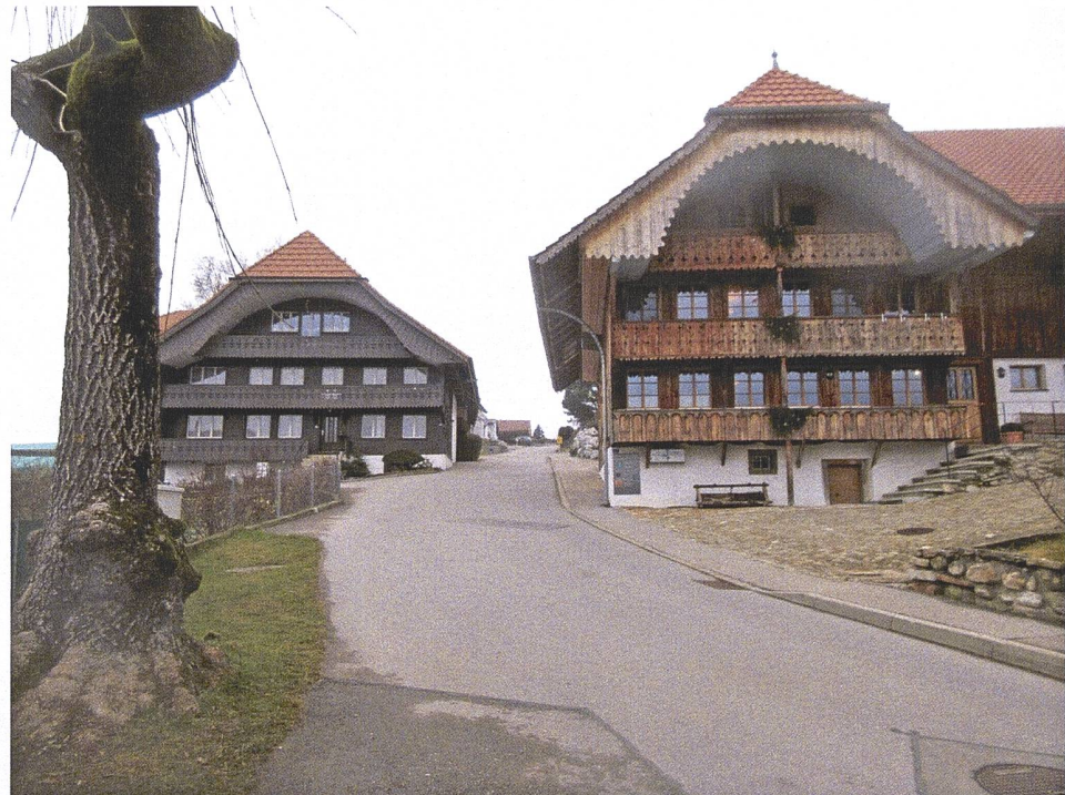
Der Dorfkern von Rechthalten (unten).