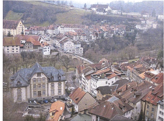
Freiburger Unterstadt (Bild oben).

Freiburg ist für Jenische ein historischer Ort. In der Freiburger Unterstadt haben immer Jenische gelebt. In den Freiburger Orten Rechthalten und Zumholz und anderswo sind bekannte jenische Familien beheimatet.