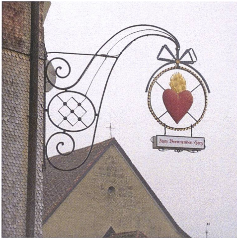
Schild eines Restaurants in Rechthalten mit dem einmaligen Namen «Zum brennenden Herz».