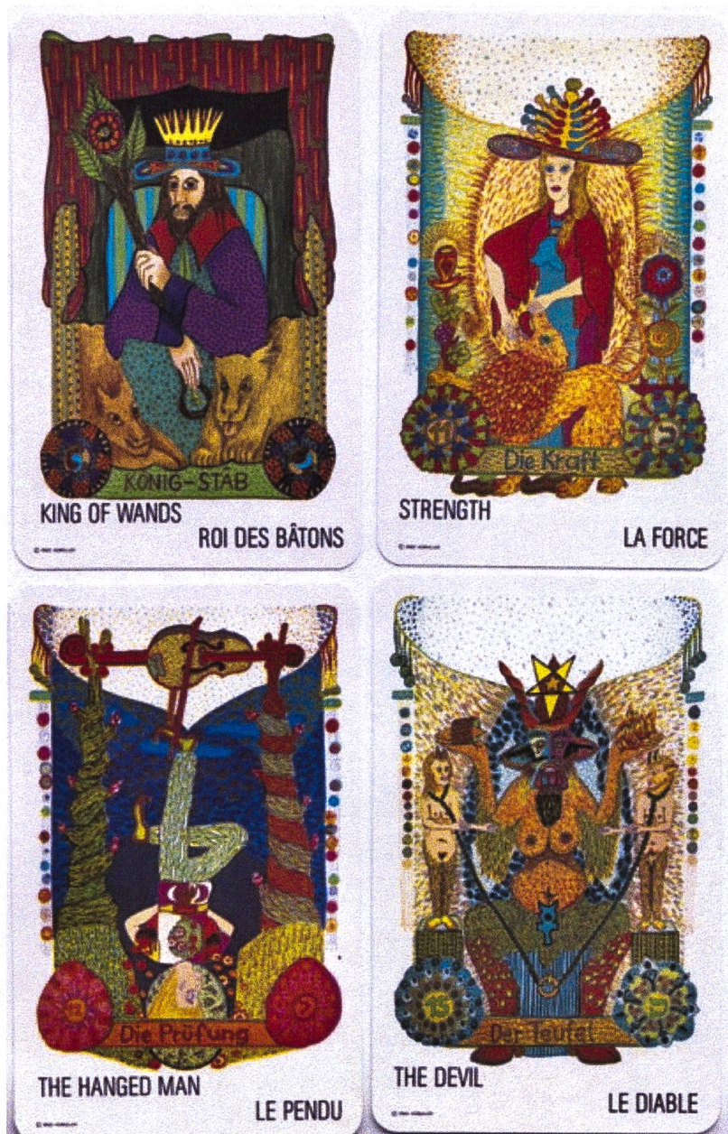
Karten aus dem von Wegmüller geschaffenen prächtigen Zigeuner-Tarot. Ein Exemplar befindet sich auch in unserem Museum.

ben. Und last but not least war er in den 1970er Jahren Mitbegründer und von 1978 bis 1981 Präsident der Radgenossenschaft. Wahrlich: Ein schillerndes, farbenprächtiges Leben und ein grosses künstlerisches Werk! Wir danken dir dafür.