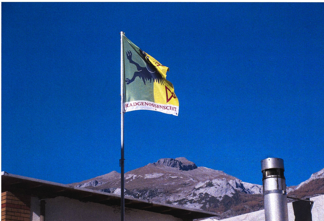
Die Fahne der Radgenossenschaft vor der Silhouette des Calanda; sie hängt beim „Olmischen Kober“ im Welschdörfli in Chur.

Wir danken zum Jahresende unseren Verwaltungsräten: