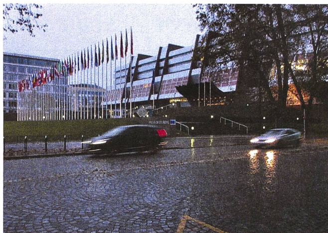
Vor dem Gebäude des Europarates in Strassburg.