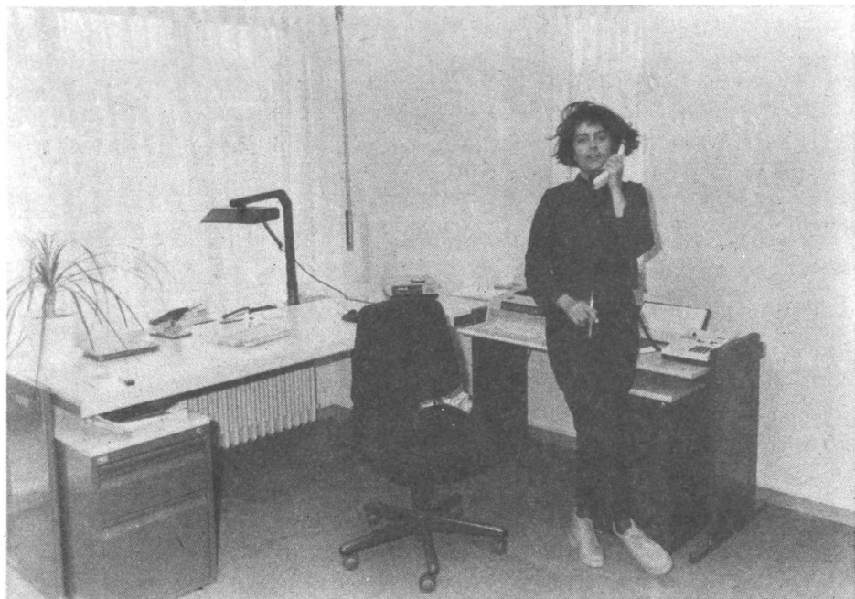
Unsere neue Büroangestellte bei der Arbeit.