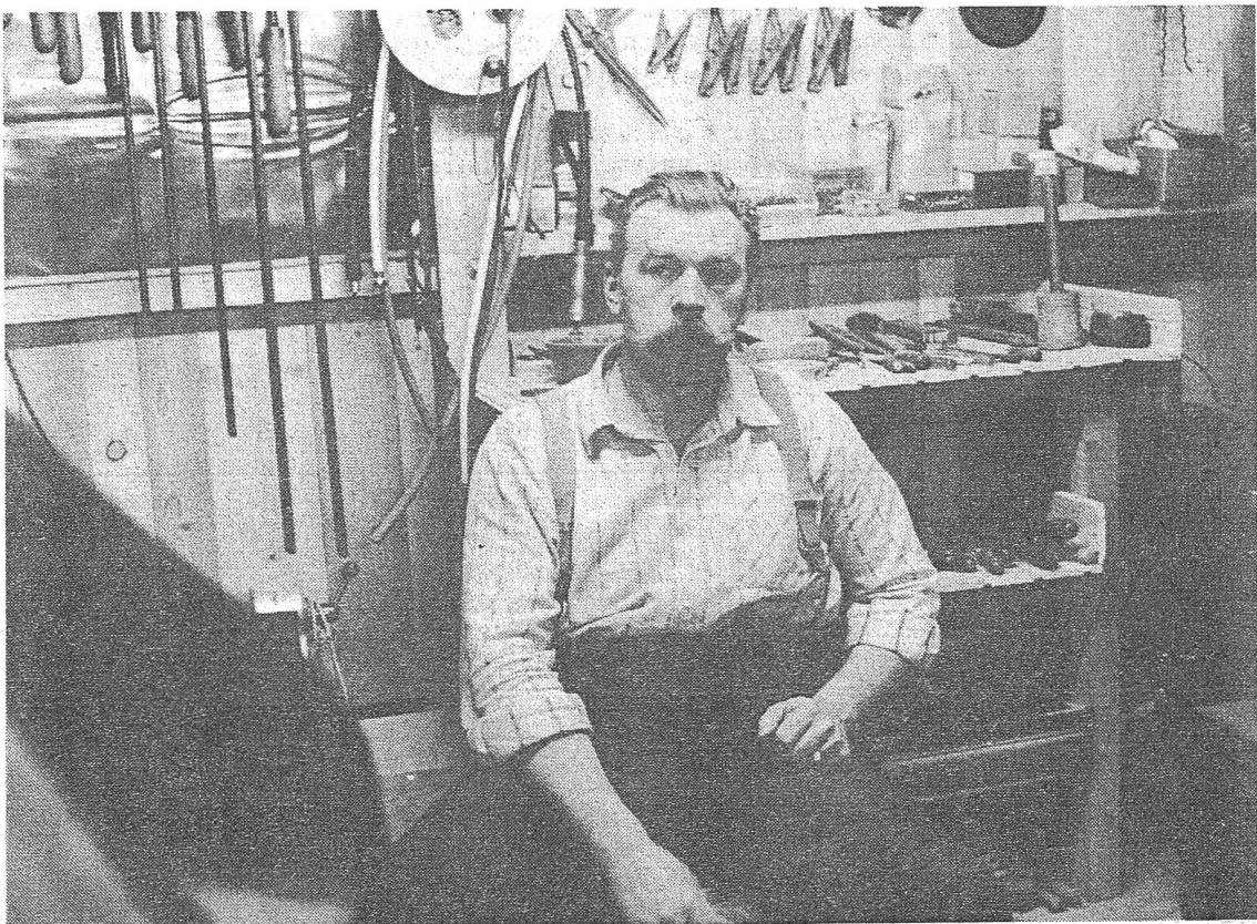
"Abfahre": Hofdokumentation, Stechapfel-Verlag, Zürich)