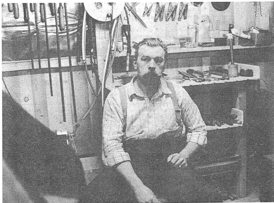
"Abfahre": Hofdokumentation, Stechapfel-Verlag, Zürich