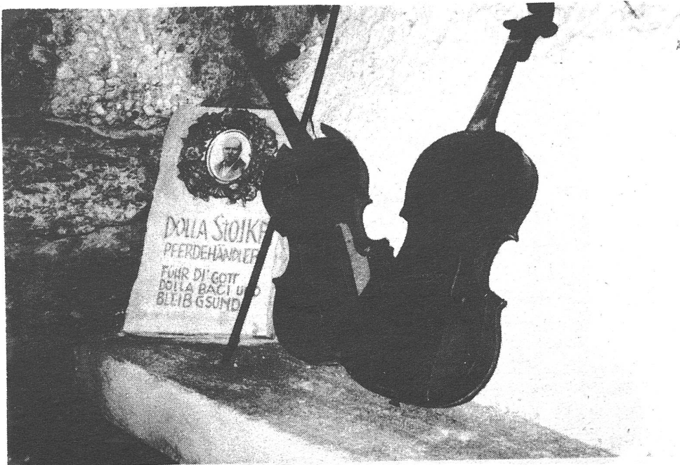
"Z i g e u n e r g r u b e"

(Der Name ZIGEUNERGRUBE war einst Bezeichnung für die Wohnstätte und den Treffpunkt der Zigeuner am Neusiedler See)