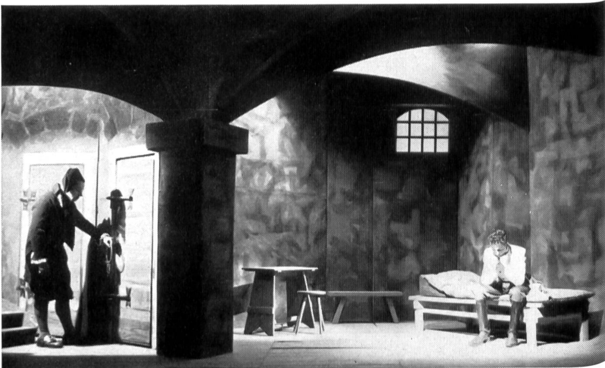
Oben: Wädenswil, Freunde des Volkstheaters, »EIDGENOSS KRÄTTLI« von Joseph Villiger [Uraufführung] Unten: Immensee, Kollegibühne, »DIE FREIHEIT DES GEFANGENEN« von Edzard Schaper [Uraufführung]