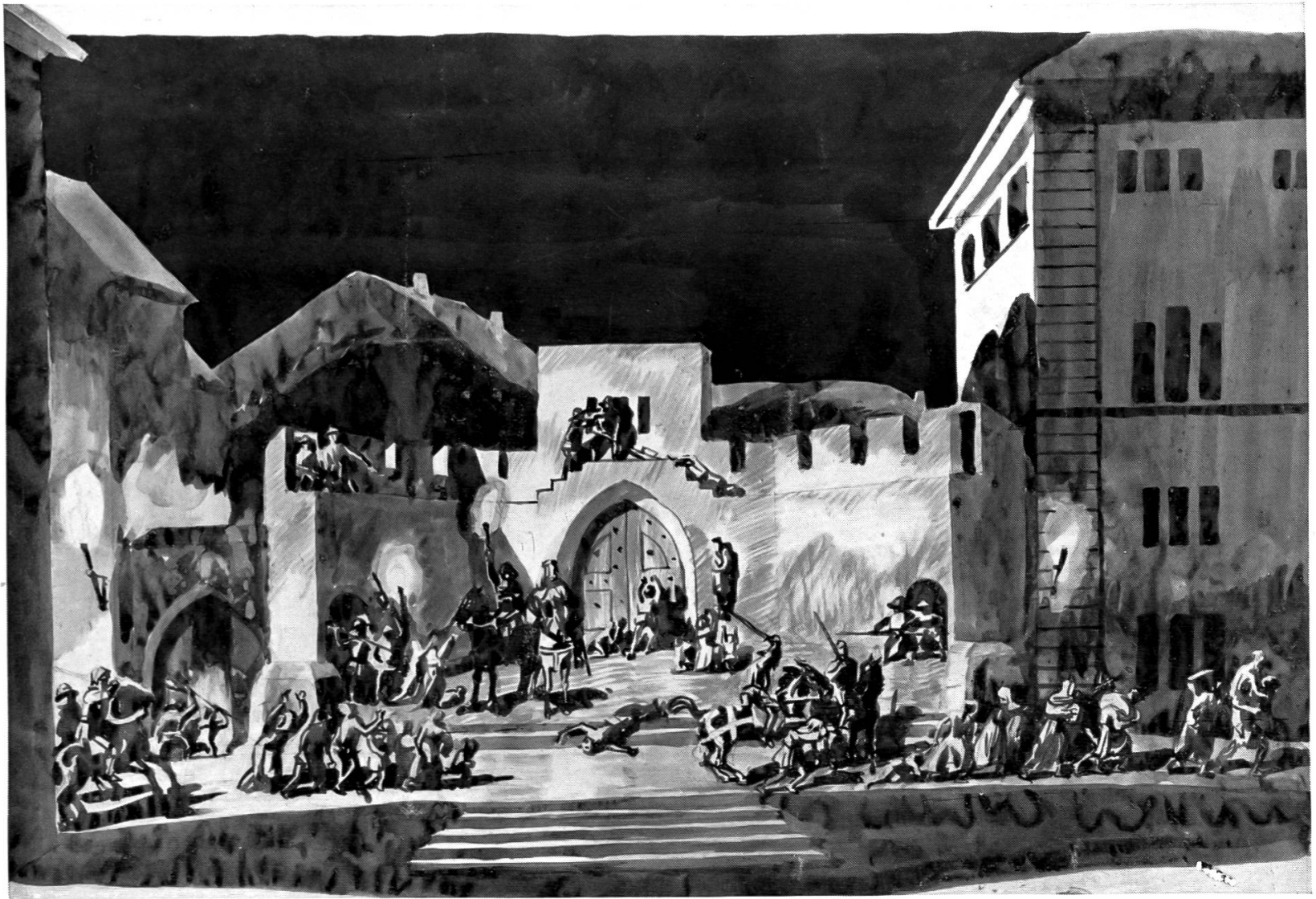
Das Rapperswiler-Spiel vom Leben und vom Tod. Ueberfall der Zürcher. 1929.