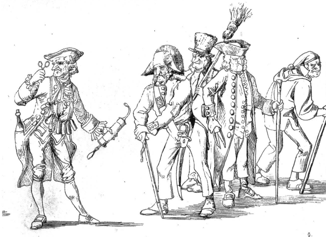
Bild 3 Fastnachtsspieltypen aus dem Spiel von 1865

(Von links nach rechts: Feldscherer, Landspfeifer, Schwertfeger, Landschleifer, Jörlfieri)