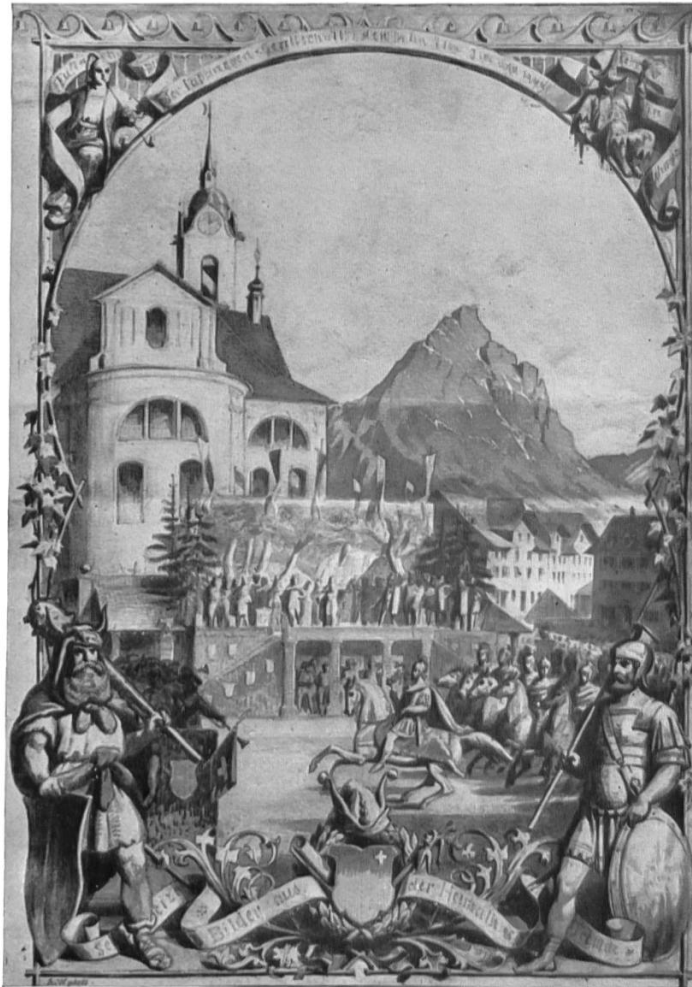
Bild 2 Die Bühne von 1869