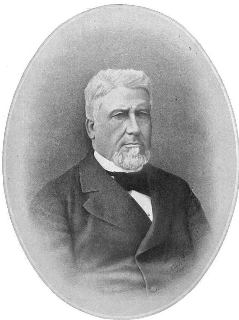
Nationalrat Ambros Eberle