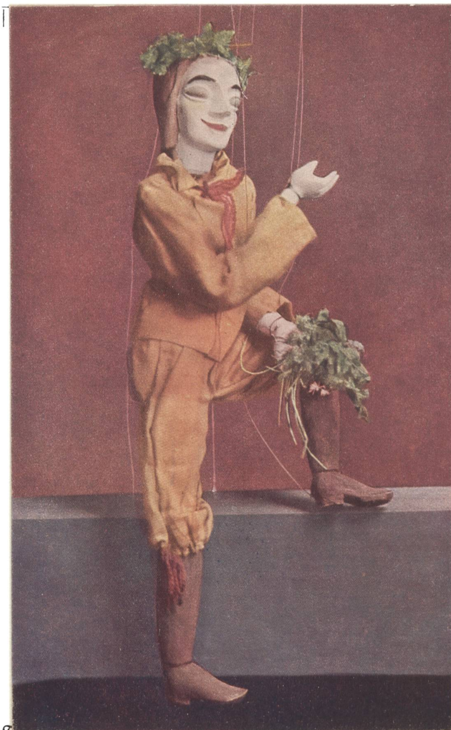
Figur ja „Lupfen und Lupenne“, Puppier von A. W. Mojaui. Inszenierung: Paul Bodmer. Farbendruck der Kunstgewerbeschule Zürich.