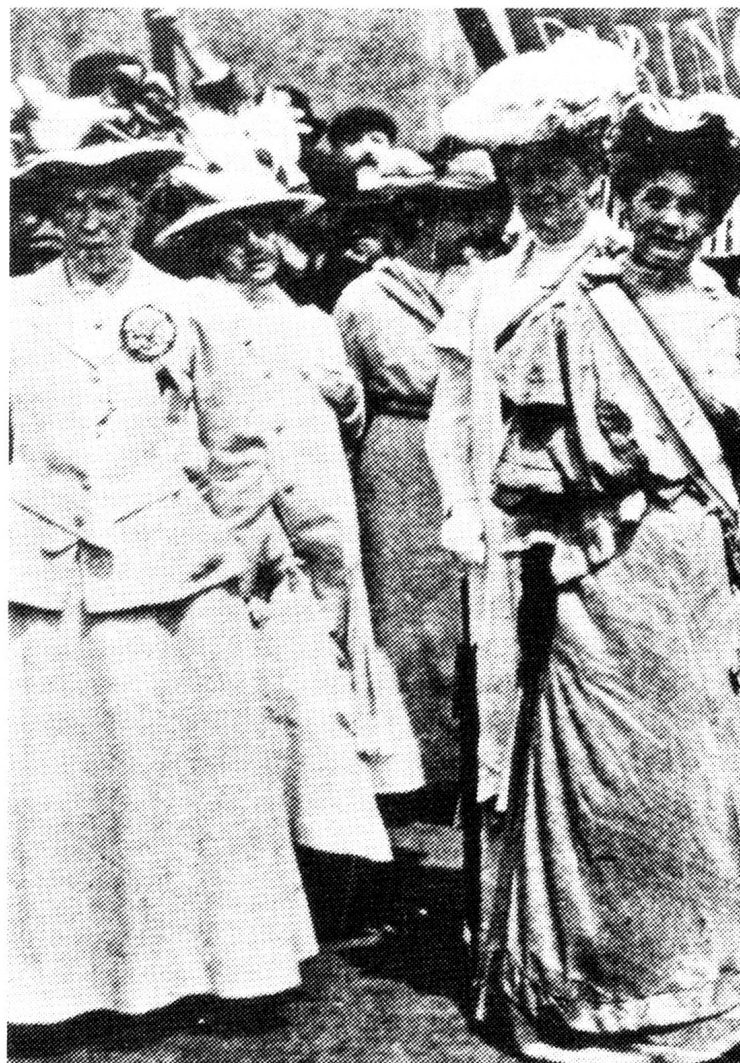
Unsere streitbaren Vorfahrinnen: englische Suffrage

Die Zürcher jedoch nahmen diese Tendenzen offensichtlich mit Unbehagen zur Kenntnis. Beim Sechseläuten-Umzug vom Jahr 1870 rollte unter dem Motto «Amerikanische Verhältnis-