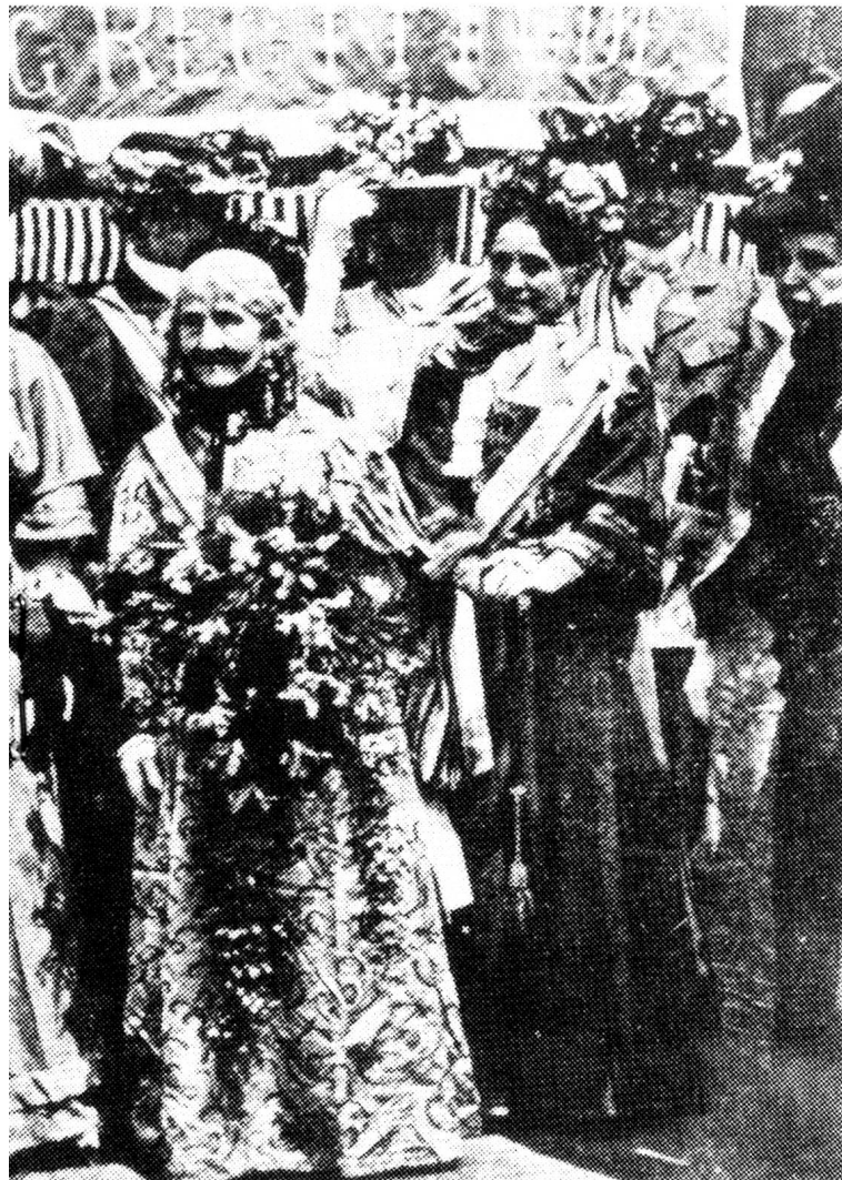
etten im Londoner Hyde Park 1908

1864 bat eine Russin aus Petersburg in einem höflichen Schreiben die Zürcher Erziehungsdirektion um die Erlaubnis, an der Universität Zürich den medizinischen Vorlesungen zu folgen. Da man — wie gesagt — in Zürich längst «Hörerinnen» kannte — schon in den vierziger Jahren war zwei Lehrerinnen dieser Status erlaubt worden —, hatten die Behörden keine Bedenken, das Gesuch der Russin zu bewilligen. Sie wurde jedoch nicht regulär immatrikuliert. Die Petersburgerin erschien, zahlte pünktlich die Gebühren und verhielt sich im übrigen so kor-