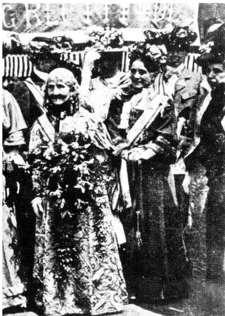
etten im Londoner Hyde Park 1908

1864 bat eine Russin aus Petersburg in einem höflichen Schreiben die Zürcher Erziehungsdirektion um die Erlaubnis, an der Universität Zürich den medizinischen Vorlesungen zu folgen. Da man — wie gesagt — in Zürich längst «Hörerinnen» kannte — schon in den vierziger Jahren war zwei Lehrerinnen dieser Status erlaubt worden —, hatten die Behörden keine Bedenken, das Gesuch der Russin zu bewilligen. Sie wurde jedoch nicht regulär immatrikuliert. Die Petersburgerin erschien, zahlte pünktlich die Gebühren und verhielt sich im übrigen so kor-