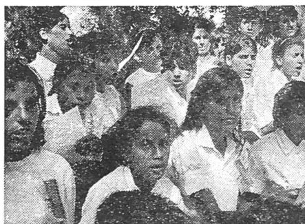
Singende Jugend im jungen Land

Verlangen Sie unverbindlich das ausführliche Programm mit Preisangaben und Anmeldetalon beim Schweizer Spiegel Verlag, Hirschengraben 20, 8023 Zürich, Tel. 01/32 34 31.