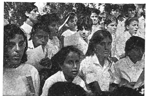
Singende Jugend im jungen Land

Ausführliches Reiseprogramm kann bei der Redaktion Schweizer Spiegel, Postfach, 8023 Zürich, angefordert werden.