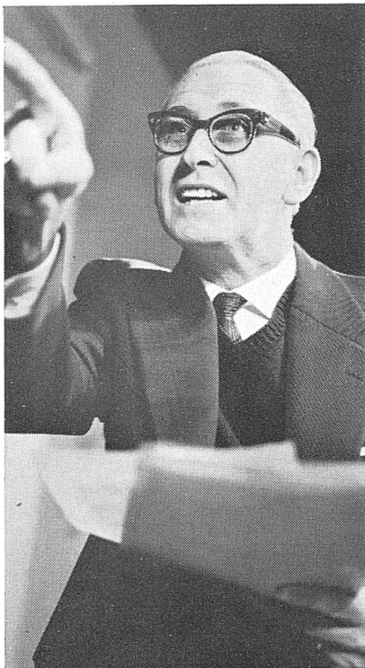
Er setzt sich mit Vehemenz für bessere Leistungen ein. Ovomaltine schafft die Voraussetzung für erhöhte Durchschlagskraft.

...kommt es auf die Leistungsfähigkeit des ganzen Menschen an. Dank ihrer ausgewogenen Zusammensetzung ist Ovomaltine der beste Energiequell zur Steigerung der geistigen und körperlichen Kräfte. Ovomaltine stärkt jung und alt, denn Ovomaltine enthält in konzentrierter Form natürliche Aufbaustoffe: Malz (gekeimte Gerste), Frischmilch und Eier mit Zusatz von Hefe, Milcheiweiss, Milchzucker und Kakao. Ovomaltine erfrischt den Geist – belebt den Körper – und mundet herrlich!