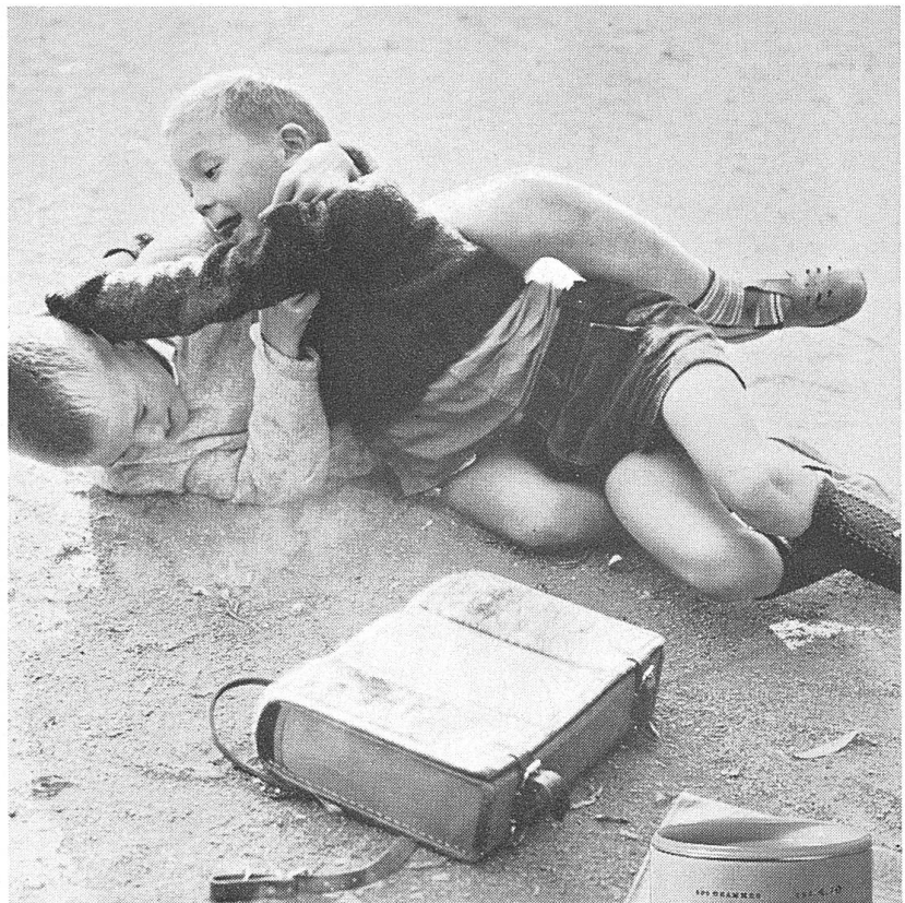
«Hosenknopf» hat er ihn genannt – dem will er's aber zeigen. Schon wegen Papi, der immer sagt: «Ovo macht dich stark!»