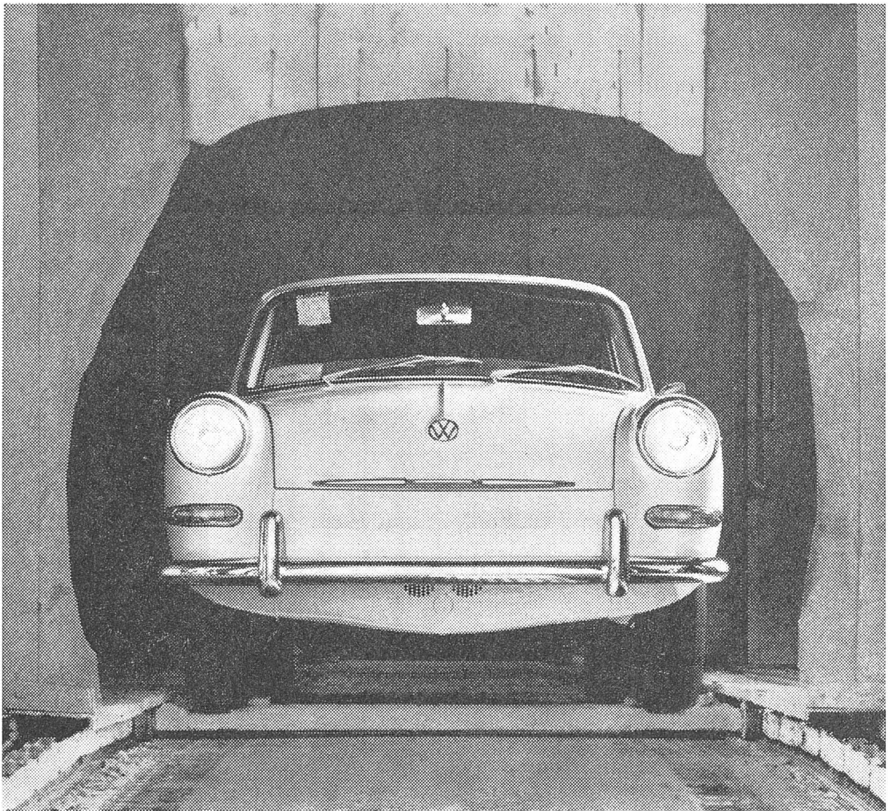
VW 1500 S Limousine Fr. 8750. —