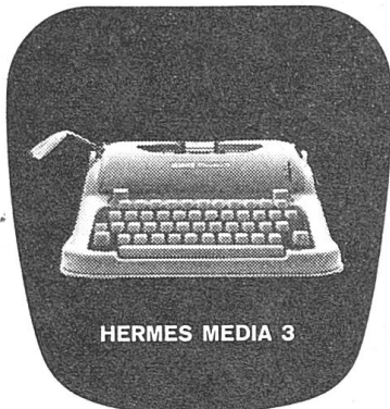
HERMES MEDIA 3