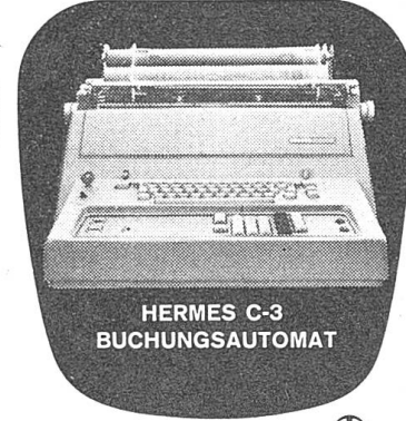
HERMES C-3 BUCHUNGSAUTOMAT

Von der kleinsten und leichtesten Akten- taschen- Schreibmaschine bis zum ersten schweizerischen Buchungsautomaten vereinigt Hermes heute in idealer Weise alles, um auch den höchsten Ansprüchen gerecht zu werden: Letzte technische Vollendung, überlegene Leistung, sprichwörtliche Schweizer Qualitätsarbeit und – nicht zu-