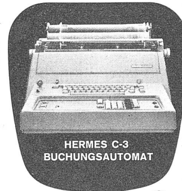
HERMES C-3 BUCHUNGSAUTOMAT

Von der kleinsten und leichtesten Akten- taschen-Schreibmaschine bis zum ersten schweizerischen Buchungsautomaten ver- einigt Hermes heute in idealer Weise alles, um auch den höchsten Ansprüchen gerecht zu werden: Letzte technische Vollendung, überlegene Leistung, sprichwörtliche Schweizer Qualitätsarbeit und – nicht zu-