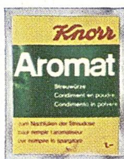
Knorr Nachfüllbeutel für Aromat und Diät-Aromat