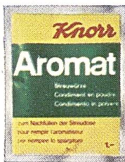
Knorr Nachfüllbeutel für Aromat und Diät-Aromat