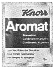
Knorr Nachfüllbeutel für Aromat und Diät-Aromat