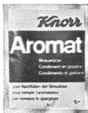
Knorr Nachfüllbeutel für Aromat und Diät-Aromat