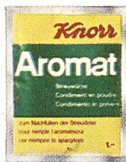
Knorr Nachfüllbeutel für Aromat und Diät-Aromat