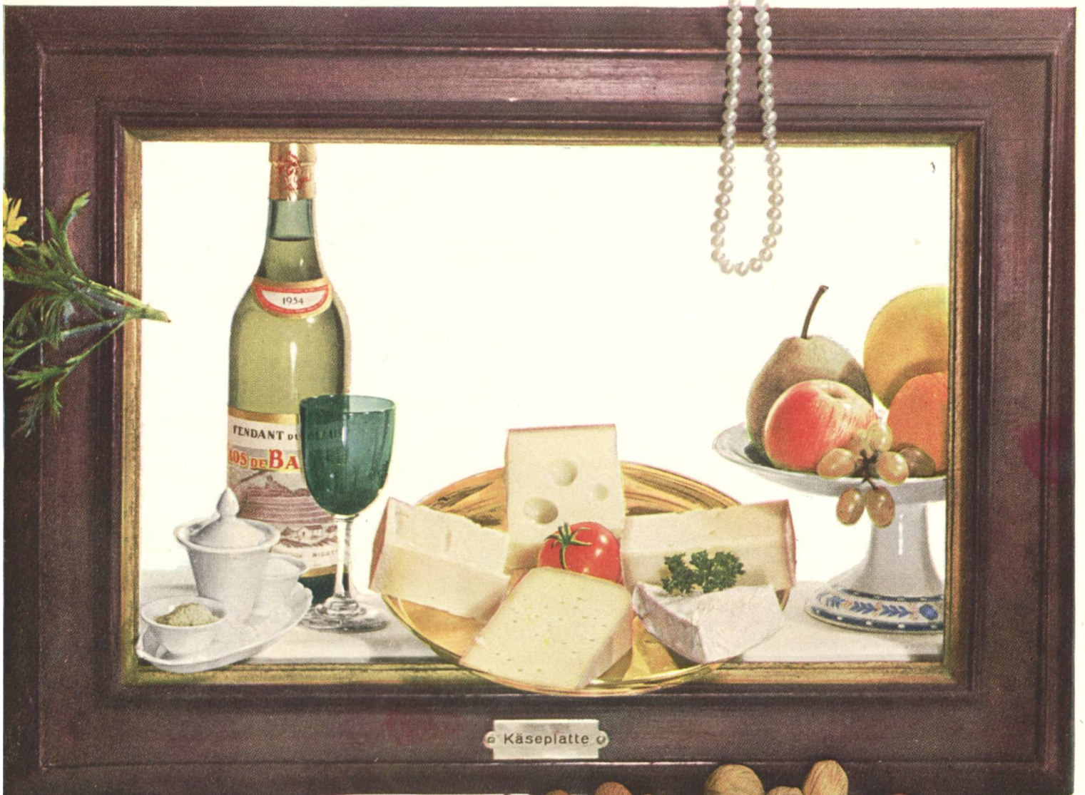
Galerie berühmter Käse: Nr. 4 Die Käseplatte

Meine Allerbeste, Sie wissen, wie sehr ich Sie verehere. Sie sind die Krönung eines guten Mahles. Ihr Reichtum an herrlichen Gaben — ich denke an Emmentaler und Greyerzer, an Tilsiter, Sbrinz und an all die vielen kleinen und raffinierten Käsesorten — vermögen den verwöhntesten Gaumen zu entzücken; Ihre guten Eigenschaften gar schmeicheln selbst dem empfindlichen Magen. «Meine Liebe», sagte ich heute morgen zu meiner Frau, «meine Liebe, mach dich auf den Abend schön. Heute wird nicht gekocht. Ich bringe Käse mit nach Hause. Auch ein guter Tropfen Fendant du Valais steht bereit. Einige Früchte werden das Mahl abrunden . . . genau so wie auf diesem Bild. Was für eine Gaumenfreude!» Verehrte Käseplatte, es war ein reizender Abend!