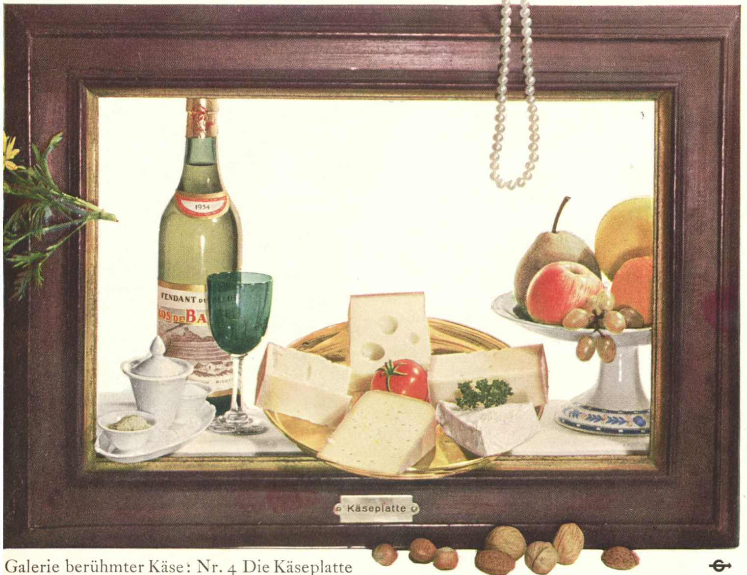
Galerie berühmter Käse: Nr. 4 Die Käseplatte

Meine Allerbeste, Sie wissen, wie sehr ich Sie verehere. Sie sind die Krönung eines guten Mahles. Ihr Reichtum an herrlichen Gaben — ich denke an Emmentaler und Greyerzer, an Tilsiter, Sbrinz und an all die vielen kleinen und raffinierten Käsesorten — vermögen den verwöhntesten Gaumen zu entzücken; Ihre guten Eigenschaften gar schmeicheln selbst dem empfindlichen Magen. «Meine Liebe», sagte ich heute morgen zu meiner Frau, «meine Liebe, mach dich auf den Abend schön. Heute wird nicht gekocht. Ich bringe Käse mit nach Hause. Auch ein guter Tropfen Fendant du Valais steht bereit. Einige Früchte werden das Mahl abrunden . . . genau so wie auf diesem Bild. Was für eine Gaumenfreude!» Verehrte Käseplatte, es war ein reizender Abend!