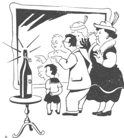
Aus unserem Kinder-Zeichenwettbewerb

Prospekte auch durch EUMIG Kunz & Bachofner, Grütlistrasse 44 Zürich 2