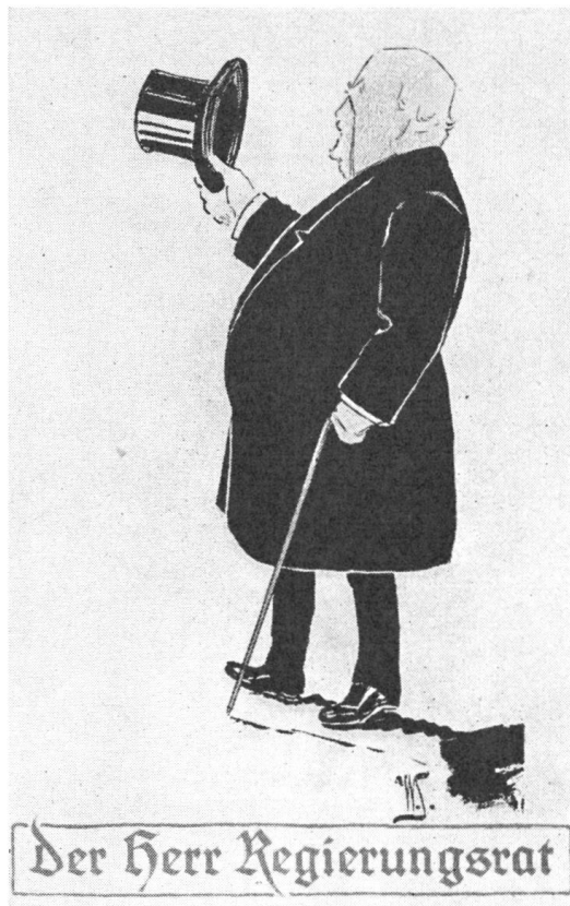
Der Herr Regierungsrat