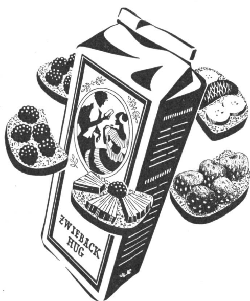
Früchteschnitten mit ZWIEBACK HUG