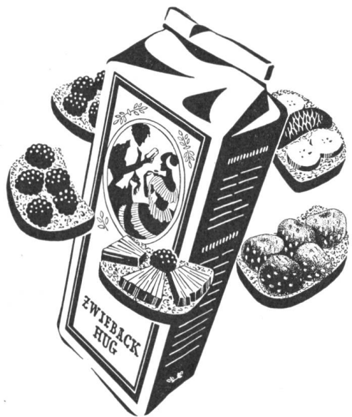
Früchteschnitten mit ZWIEBACK HUG