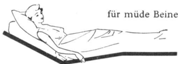
für müde Beine