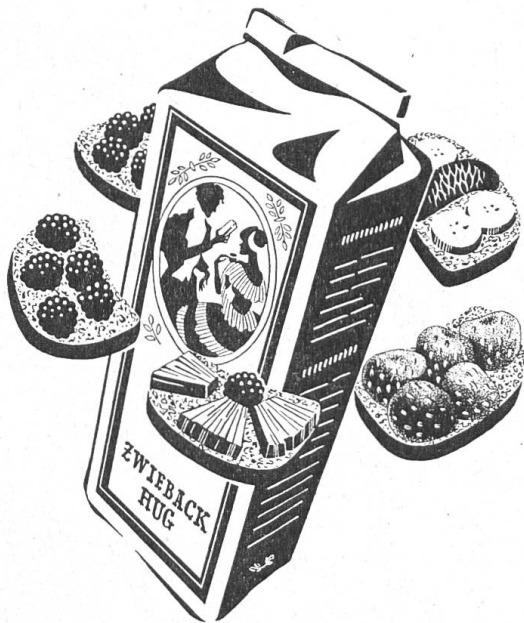
Früchteschnitten mit ZWIEBACK HUG