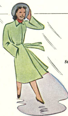
Voro-Creme schützt die Haut bei Wind und Wetter