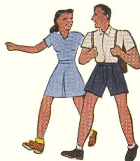
Bei Spiel und Sport die gute Voro-Creme: sie schützt und bräunt