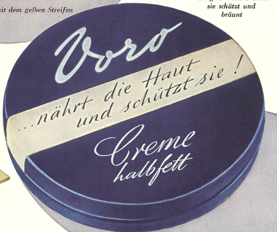
Die blaue Dose mit dem weißen Streifen