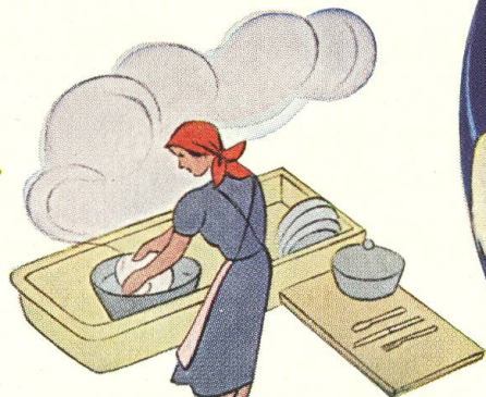
Bei Haushaltarbeit, zur Pflege der Haut altbewährt und altbekannt