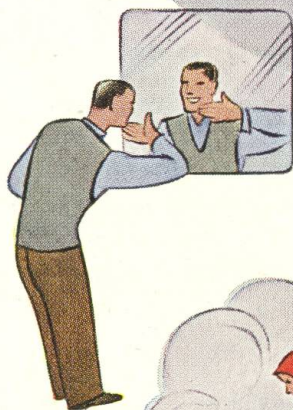
Nach dem Rasieren eine Wohltat für die Haut